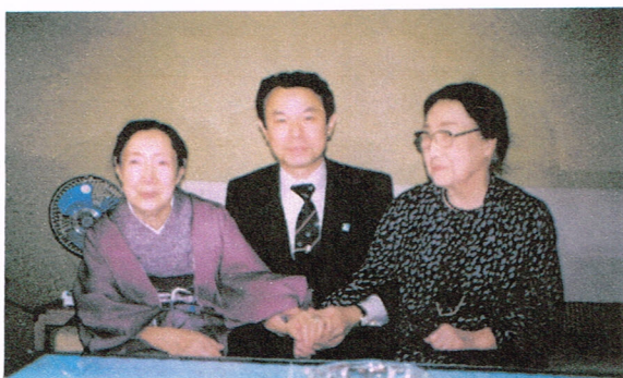
叔母と育ての母(鎌倉保育園長)

そんな時、日本テレビの池田プロデューサーが来店され、叔母との感動的対面の瞬間を記録として残したいとのことでした。