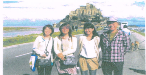
モン・サン・ミッシェル修道院(世界遺産)