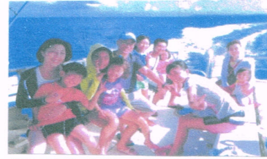
毎年、家族11名と一緒に旅行をしています。皆に喜ばれ、孫の笑顔見たさに実施しています。