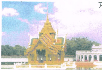
アコタヤ王朝の都 (世界文化遺産)