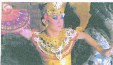
バリ伝統芸術のレゴンダンス