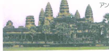
アンコールワット