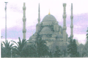
ブルーモスク (世界遺産)