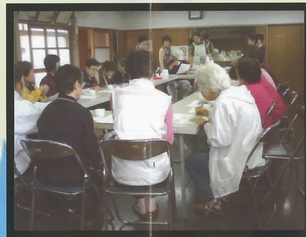
▲第1回目たくさんの人が参加しました。