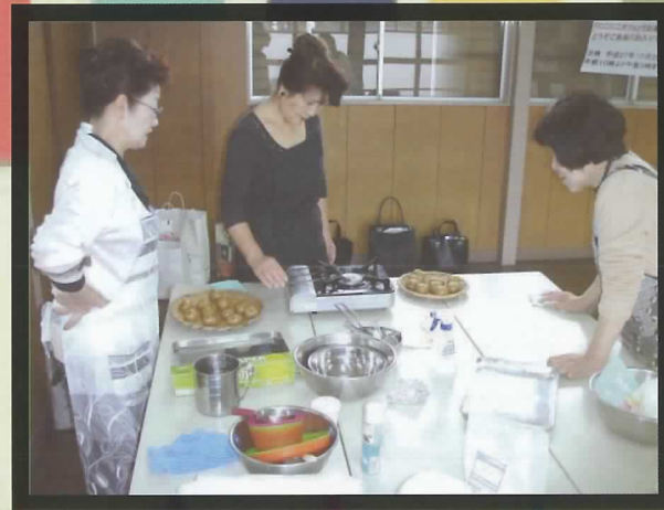
▲今回はおまんじゅう作りをし、遊びにきてくれた人たちにふるまいました。