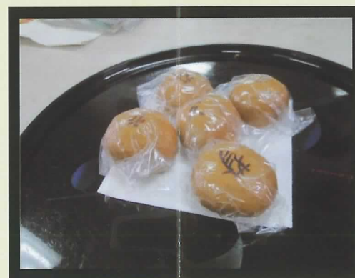
▲スタッフ手作りのおまんじゅう